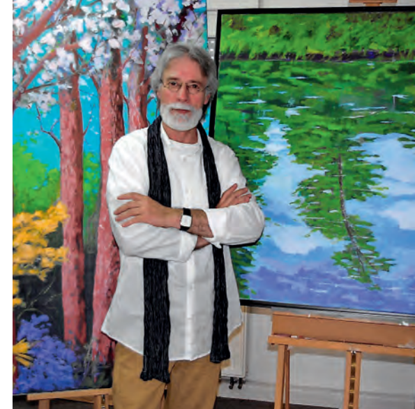
Vincenzo Di Tommaso Porträts und Landschaften