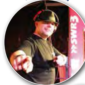
Cool Cats Orchestra