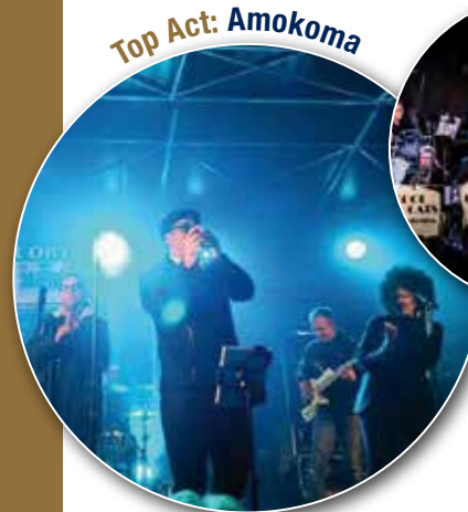
Top Act: Amokoma